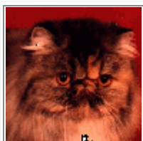
GIC MEGANE SWEET FLAME DE LA PETRERA

Une femelle peut être achetée à partir de l'âge de trois mois mais si vous avez la possibilité d'acquérir une femelle plus âgée qui a déjà fait ses preuves en concours cela sera très bien. Mais avant toute chose il faudra s'assurer de la perfection de son pedigree, de son inscription au registre qui convient et de la mise à jour de son carnet de santé. De veiller à ce que tous les tests ont bien été pratiqués (FeIV, PKD....). Elle doit être saine et sans parasites.