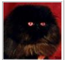
GIC BRYN MAWR PRETTY BOY FLOYD OF PETRERA

Pour s'occuper de façon satisfaisante d'un male, il faut de l'expérience et de la compréhension. En effet, la vie d'un étalon ne se limite pas à la reproduction. En dehors des « visites » des femelles, il demande beaucoup d'affection et de soins. Son installation doit être agréable et spacieuse, lui permettant de faire beaucoup d'exercice et de se prélasser au soleil.